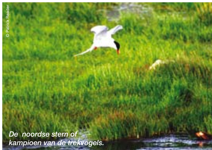
De noordse stern of kampioen van de trekvogels.

Heimaey is het belangrijkste toeristische eiland. Op 23 januari 1973 vond hier een gigantische vulkaanuitbarsting plaats. De meeste inwoners werden de eerste avond naar het vasteland geëvacueerd. Bijna zes maanden later was de razernij van de aarde bekoeld en konden de mensen terug naar het eiland. Vandaag draait het leven weer op volle toeren en is Heimaey zoals vandaan het belangrijkste visserijcentrum van IJsland. In de zomer draait het toerisme op volle toeren. Er zijn hier meer mogelijkheden op het vlak van de activiteiten dan in het noordelijke Grimsey. De geologie en de golvende vormen van het eiland exploderen in een symfonie van okerkleuren die nog de sporen van het verleden draagt. Vrijwel langs heel de kustlijn van het eiland kunnen hikers hun hart ophalen. Je kan ook per fiets of te paard de heuvelachtige wegen van het eiland verkennen en schitterende