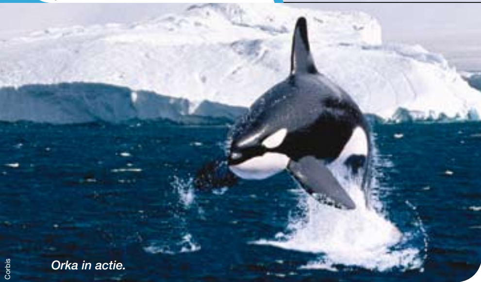
Orka in actie.

lammeren naar het verrukkelijke gouden strand van Raudasandur...Als de zon schijnt, straalt deze zandwoestijn aan de rand van de zee in al zijn pracht en lijkt het bijna dat je in Tunesië of in de tropen bent.